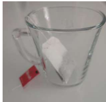
Slika 2 Priprema čaja