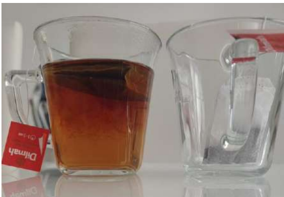
Slika 3 Posluženje čaja