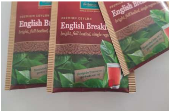
Slika 1 Pakovanje čaja